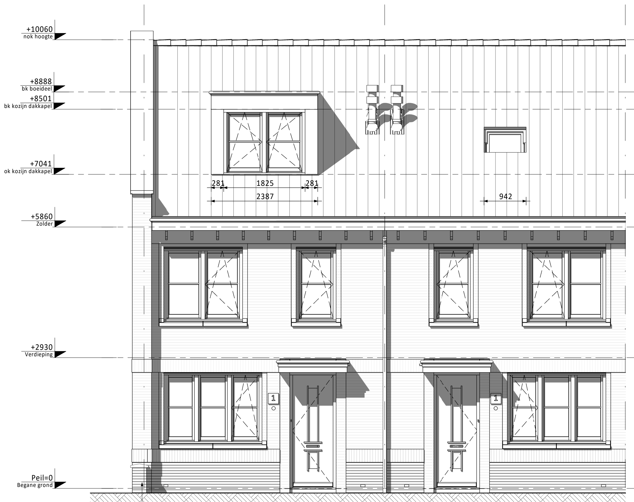
Voorgevel (as) • Dakkapel voorzijde (niet mogelijk bij bwnr. 3) (as) • Dakraam voorzijde (niet mogelijk bij bwnr. 3)