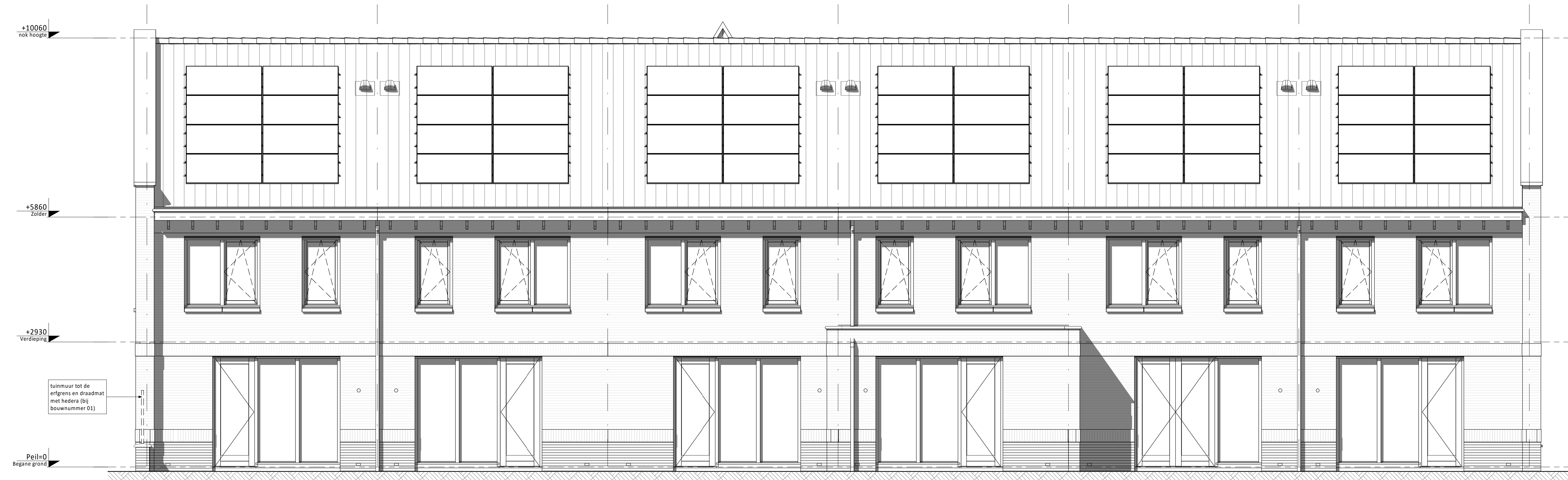
Achtergevel (as) • Basis achtergevel (as) • Basis achtergevel (as) • Basis achtergevel (as) • Aanbouw 1,2m achtergevel (op de begane grond) (as) • Dubbele openslaande deuren achtergevel (as) • Basis achtergevel (as)