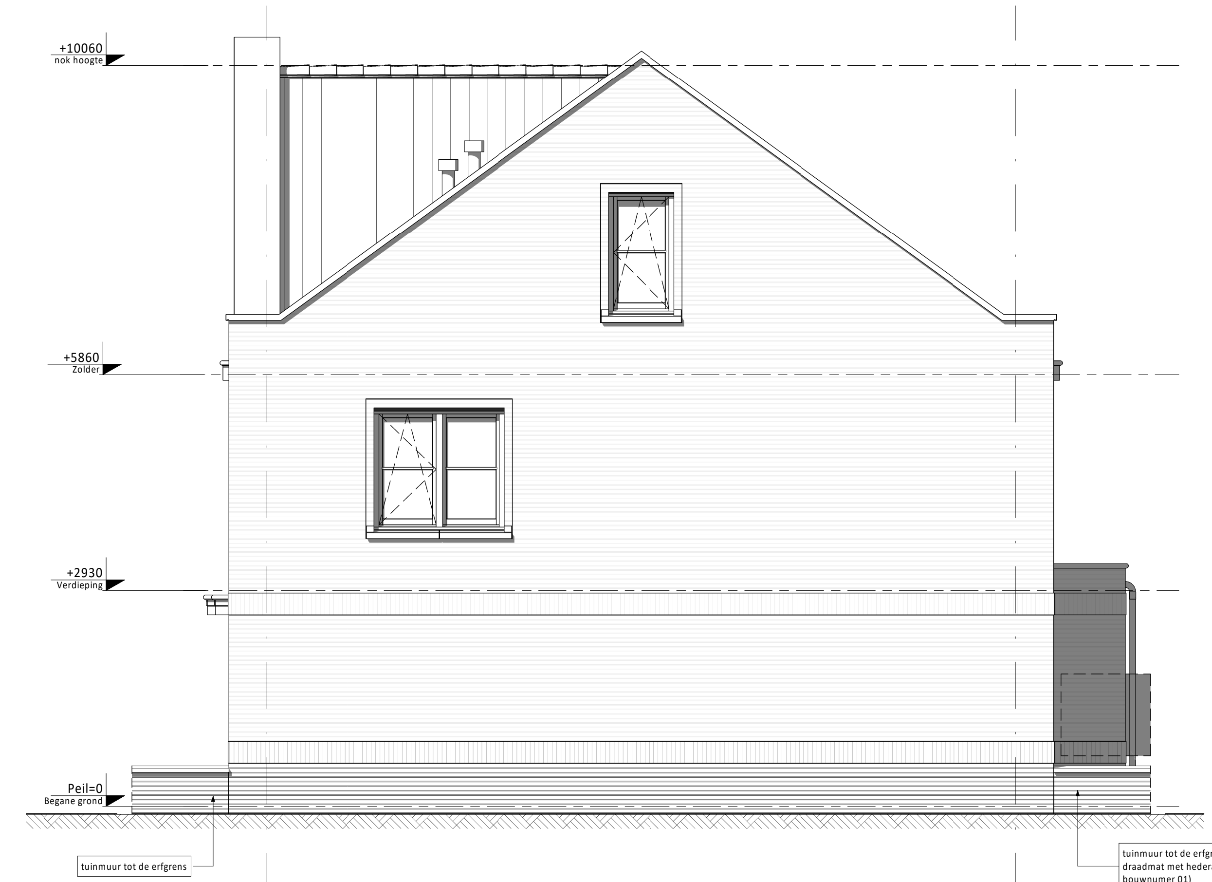
Rechter zijgevel (A) • Aanbouw 1,2m achtergevel (op de begane grond) • Breed kozijn in zijgevel verdieping (standaard en alleen mogelijk bij bwnr. 01) • Smal kozijn in zijgevel zolder (standaard en alleen mogelijk bij bwnr. 01) • Tuitgevel voorzijde (standaard en alleen mogelijk bij bwnr. 03) (B)

Ventilatie dakraam n.t.b. positie (m.u.v. woningen met een tuitgevel voorzijde)